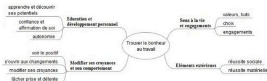
Figure 2 : Arbre thématique représentant les facteurs qui ont permis de retrouver le bonheur au travail.

Fig. 1 : Arbre thématique représentant la réinsertion professionnelle ; fig. 2 : Arbre thématique représentant les facteurs qui ont permis de retrouver le bonheur au travail.