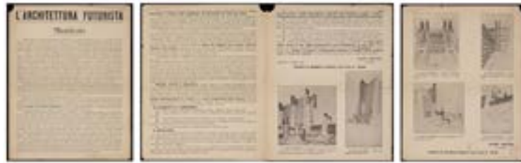
Figure 2 : Antonio Sant'Elia, L'architecture futuriste , imprimé en italien sur tract plié et illustré, datant du 11 juillet 1914, et publié de nouveau avec quelques variations dans Lacerba , II e année, n° 15, 1 er août 1914.

Affichant un panthéon artistique futuriste complet et probablement pour le plus grand plaisir de Marinetti, la publication du manifeste futuriste coïncide avec la déclaration de guerre de l'Allemagne à la Russie et ainsi le début de la Première Guerre mondiale.