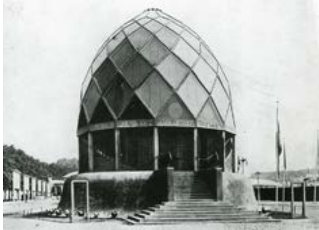
Figure 3 : Exposition du Werkbund de 1914 à Cologne. Le Pavillon de verre de Bruno Taut vu de l'extérieur.

ou le cristal peuvent devenir la marque d'un nouveau contrat spatial que l'humanité signerait pour maîtriser son instinct violent, en adoptant une posture permanente de vulnérabilité : « Qu'est-ce qui se casse plus facilement que le verre ? » (Ruest, 1919 : 270), affirme l'écrivain berlinois Anselm Ruest, ami proche de Scheerbart, avançant son nom à plusieurs reprises pour le prix Nobel de la paix.