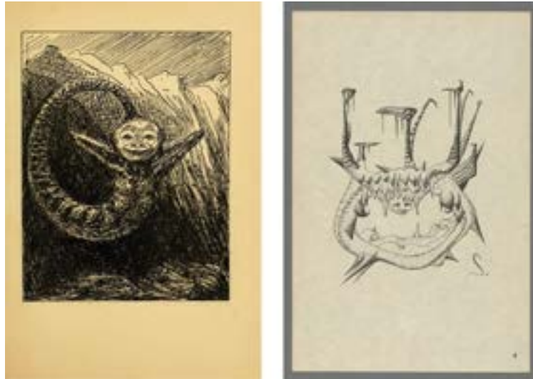
Figure 5 : De Kubin à Scheerbart.

[Le] plus remarquable élément des habitants de cette planète est qu'aucun d'entre eux ne se ressemble : chacun a ses propres membres particuliers, certains plus courts, d'autres plus longs, beaucoup d'entre eux comme des tubes et flexibles comme du caoutchouc, d'autres sous forme de scies, dures comme l'acier et avec beaucoup de dents, tous différents (Scheerbart, 1902 : 70).