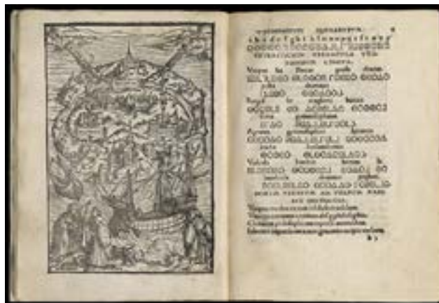
Figure 1 : MORE, Thomas (1516a), L'utopie (De optimo rei publicae statu, deque nova insula Utopia) , Louvain, Dirk Martens, 1516, p. 12-13.

Seulement la plus fine étendue d'océan sépare [l'île de] l'Utopie du continent. Pour un quelconque part si fameusement et constitutivement nulle part, ce non-lieu de l'Utopie est très proche de la rive (Miéville, 2016).