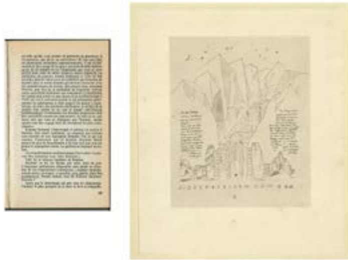
Figure 4 : De Scheerbart à Taut.

à l'articulation de notes musicales, « de la fugue pour orgue au plus délicat des solos capriccio » (Taut, 1921 : 120).