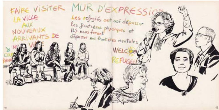
Figure 9 : Campement Gergovia, Université Clermont Auvergne, 2017.

© Bruno Pilorget, Réfugier [Carnets d'un campement urbain] (La Boîte à Bulles, 2021).