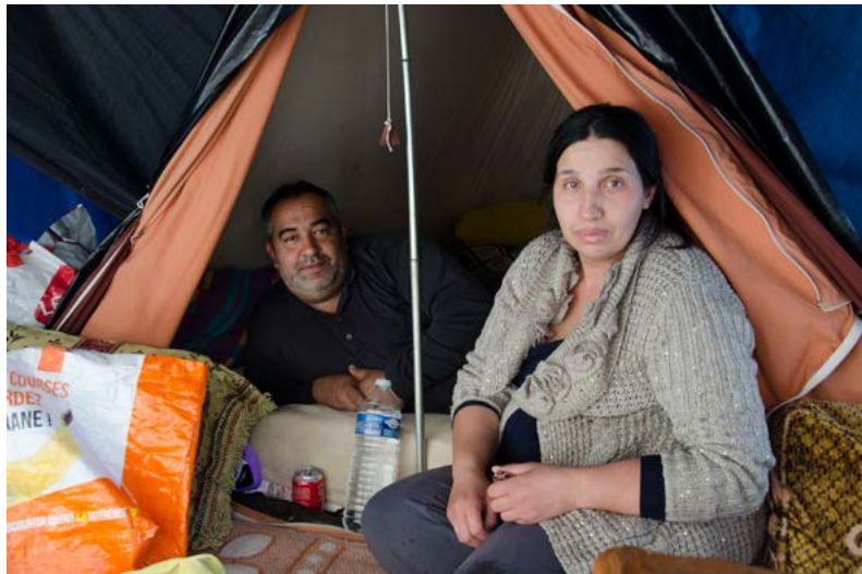
Figure 4 : Campement Gergovia, Université Clermont Auvergne, 2017.

exposée. Le coffret Réfugier [Carnets d'un campement urbain] 14 rend compte d'une telle exposition, en témoignant de l'installation, en octobre 2017, d'un campement de fortune par des familles et des jeunes migrants à « Gergovia », à la faculté des lettres de l'université de Clermont-Ferrand. Les vitres de la bibliothèque universitaire donnaient directement sur les tentes du campement. Un quotidien presque ordinaire se déroule donc dans un habitat extraordinaire.