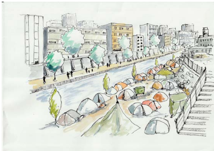
Figure 1 : Réfugier [Carnet d'un campement urbain]

Malgré nos enclos, nos Babels, nos ravages, quelque part la parole converge et nous relie. Andrée Chedid, Fraternité de la parole .