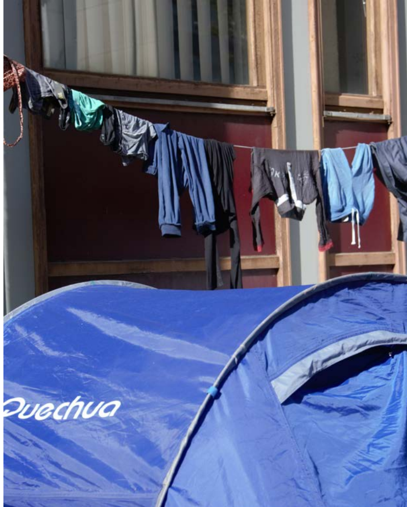
Figure 2 : Campement Gergovia, Université Clermont Auvergne, 2017.

© Christophe Guimard, Réfugier [Carnets d'un campement urbain] (La Boîte à Bulles, 2021).