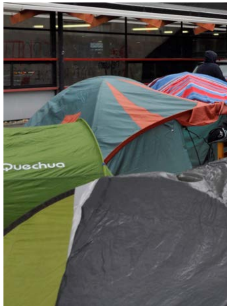
Figure 3 : Campement Gergovia, Université Clermont Auvergne, 2017.

sanitaires, à l'insécurité également. Les formes du refuge et de l'abri qui sont celles du campement – comparables à celles du squat – inscrivent par conséquent l'habiter dans la fragilité. Dans une certaine mesure seulement – car les conditions du campement demeurent ici très spécifiques –, la précarité du campement s'apparente à celle de la halte en voyage, moment et lieu de transition, de transit : le lieu de l'étape n'est ordinairement pas choisi ou pas forcément choisi, il est parfois imposé et peut être « un lieu de résidence forcé et contraint 13 », à grande distance du topos de la retraite volontaire et féconde. Évidemment, la précarité est plus grande encore dans le campement. Les étapes imposées se répètent à plusieurs moments de l'itinéraire des personnes exilées, la survie prévaut pour certaines d'entre elles à toute autre considération. Vivre une étape de ce déplacement ne consiste pas à renoncer provisoirement à un confort que l'on sait retrouver ensuite, mais s'apparente souvent à un sacrifice sans retour.