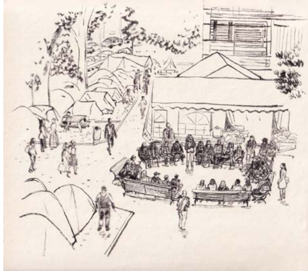
Figure 7 : Campement Gergovia, Université Clermont Auvergne, 2017.

© Bruno Pilorget, Réfugier [Carnets d'un campement urbain] (La Boîte à Bulles, 2021).