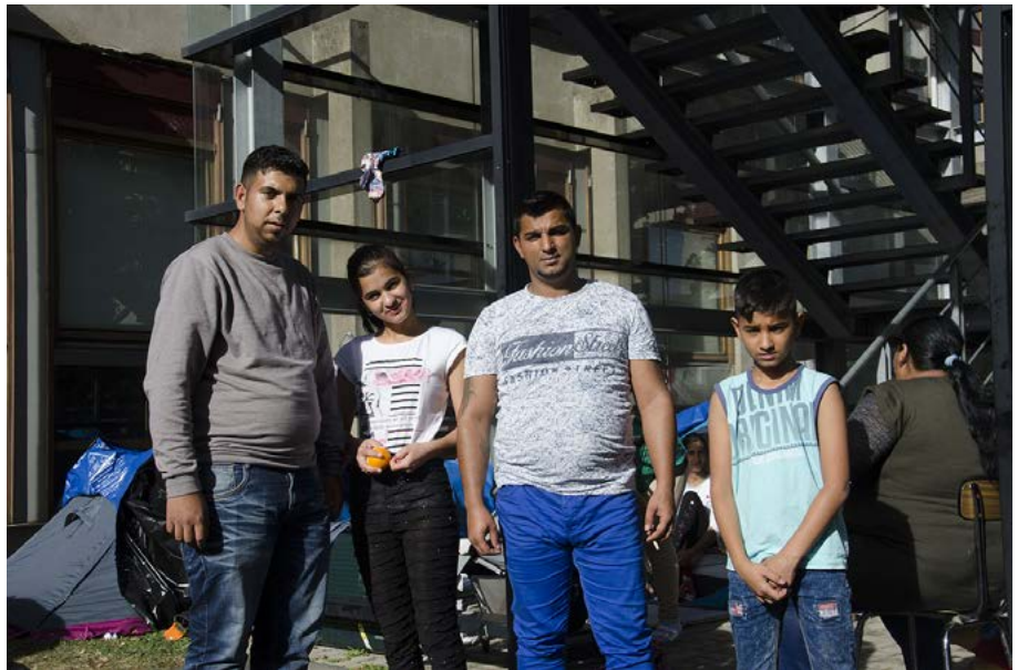
Figure 6 : Campement Gergovia, Université Clermont Auvergne, 2017.

Habiter l'éphémère entrave en outre toute projection concrète dans le futur – alors même que le passé a été abandonné et que le présent existe à peine. On s'inscrit alors dans une temporalité très spécifique, dont d'autres formes sont identifiables dans le topos de l'étape 31 . Le campement est non seulement un non-lieu, mais aussi un non-temps, perceptible dans Témoigner [Chroniques du campement Gergovia] à travers les motifs topiques du suspens et de l'attente :